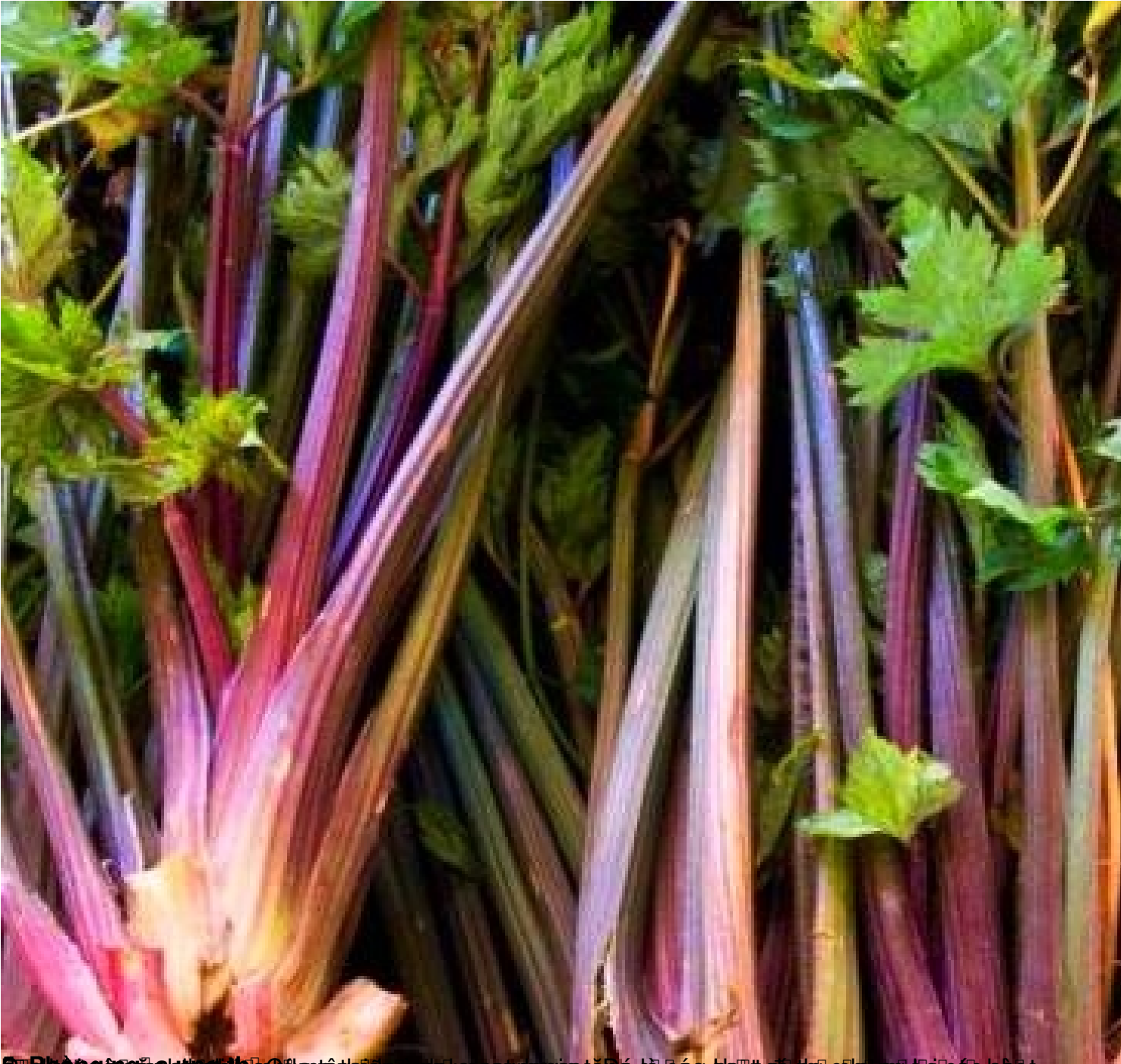
6. Phèn găng (Cải xoăn) là một loại rau họ cải, có vị chua ngọt, thường được dùng để nấu canh chua hoặc xào. Nó là một loại rau ăn lá, có thể dùng để nấu canh chua hoặc xào.